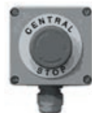
Centrál stop typu (polyesterová skriňa)