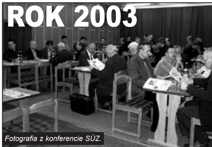
Fotografia z konferencie SÚZ.