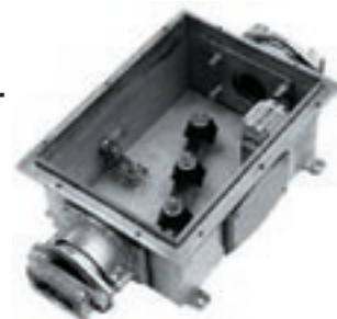
Oceloplechová svorkovnicová skriňa