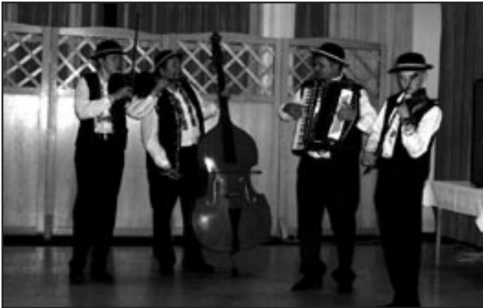
Fotografie z kultúrneho programu konferencie SÚZ.